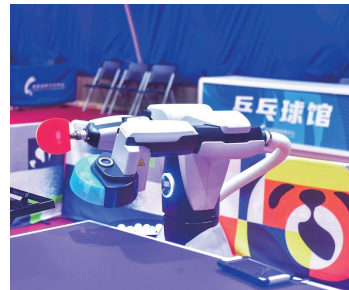
乒乓球陪练机器人

此外,主媒体中心的清洁机器人、大运村里的咖啡拉花机器人、餐厅里的小吃机器人……各式各样的机器人亮相大运会,让本次大运会成为了“智慧赛事”。成都大运会所展现出的不仅是热情、力量与美,更是目不暇接的科技赋能、活力创新与闪亮智慧,这是历史与现实的交融,也是青春与梦想的碰撞,更是一曲关于未来科技的赞歌。