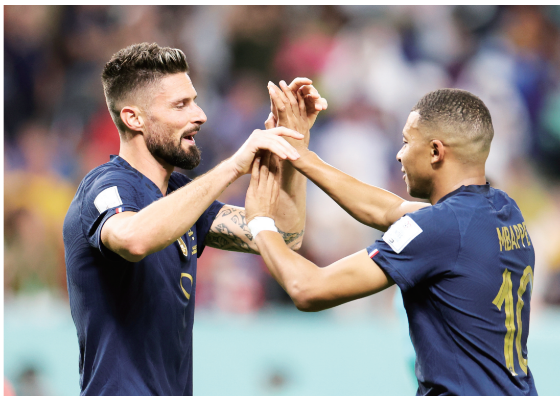
法国队球员吉鲁(左)与队友姆巴佩庆祝进球