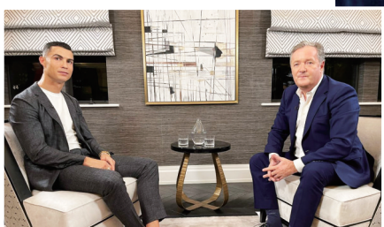
C罗(左)接受皮尔斯·摩根采访