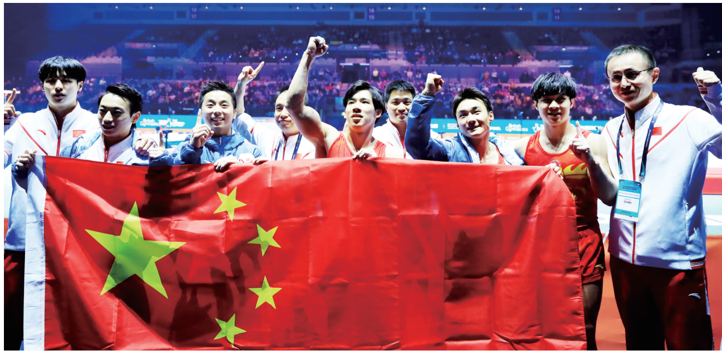
中国队夺得男子团体冠军

中国体操队在本届世锦赛中派出了“三老带两新”的男团阵容,最初制定的目标是登上领奖台。虽然在资格赛中获得第四名,但这个全新的团队在决赛中逆袭成功,最终的总得分领先亚军日本队将近4.5分。这场胜利帮助队员们增强了信心,以更好的姿态迎接巴黎奥运会。本版撰稿 本报记者 吴钧雷