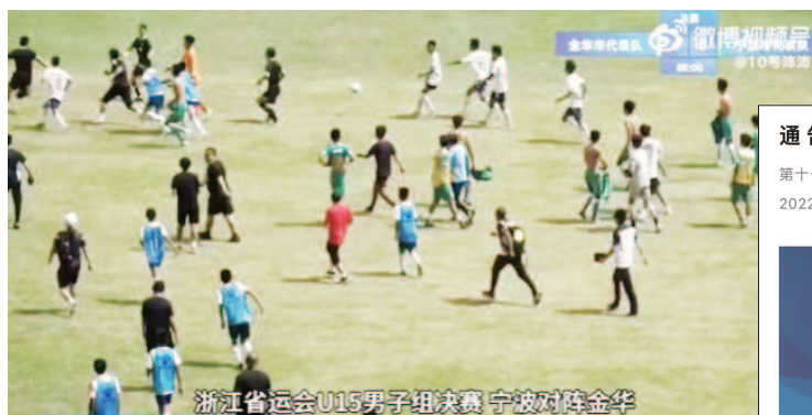
浙江省运会U15男子组决赛 宁波对阵金华