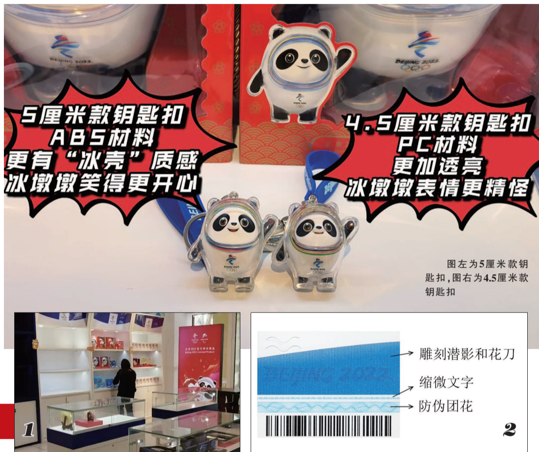
图左为5厘米款钥匙扣，图右为4.5厘米款钥匙扣

1.3月9日，赛特奥特莱斯北京2022官方特许商品零售店内，店员正在整理货品 2.特许商品防伪标签（贴标）细节说明