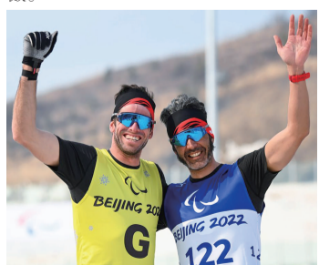
3月9日，加拿大金牌得主布赖恩·麦基弗（右）和领滑员罗素·肯尼迪在北京冬残奥会残奥越野滑雪男子短距离自由技术（视障）决赛后庆祝

“超级碗”转播中，播放了讲述麦基弗兄弟成长故事的公益广告，布赖恩一直以能为更多人带来正能量而感到骄傲。