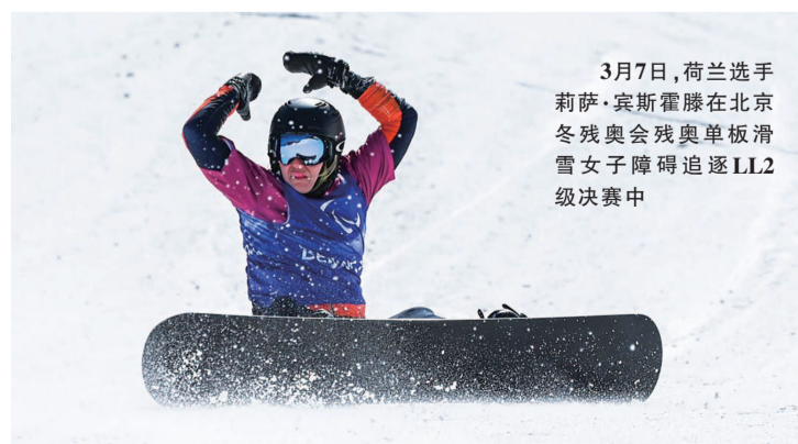
3月7日，荷兰选手莉萨·宾斯霍滕在北京冬残奥会残奥单板滑雪女子障碍追逐LL2级决赛中

作为北京冬残奥会开幕式荷兰代表团双旗手，残奥单板滑雪运动员莉萨·宾斯霍滕都已在单板项目亮相。福斯和宾斯霍滕已经结婚八年，两人共同生活，共同训练，切磋技术，共同参赛。两人在平昌冬残奥会上都收获了银牌，妻子宾斯霍滕更是一筹，还有一枚铜牌入账。在北京冬残奥会赛场，两人目前还没有奖牌入账。此前，两人分别跻身残奥单板滑雪男、女障碍追逐决赛，福斯最终排名第四，宾斯霍滕决赛中对手发生碰撞未能完赛。两人11日将转战残奥单板滑雪坡面回转项目，向奖牌再次发起冲击。24岁的福斯，还有一个载入残奥史册的纪录——八年前在索契冬残奥会上，他成为冬残奥会历史上第一个完成残奥单板滑雪比赛的选手。除了滑雪，两人还有其他爱好，宾斯霍滕喜欢骑马，福斯考取了飞行员驾照，滑雪让他爱上了“飞”的感觉。摘自 新华社