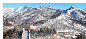
7号风景摄像机：八达岭长城