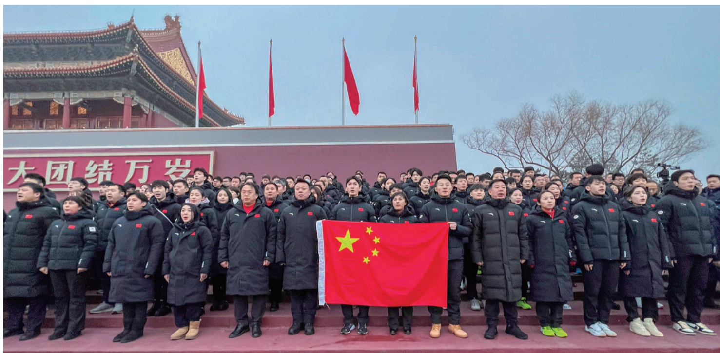
▲1月25日清晨，北京冬奥会中国体育代表团的100多名运动员和教练员代表，来到天安门广场观看升旗仪式，并宣誓出征。出征仪式由武大靖领誓，宣誓结束后，运动员将陆续进入闭环管理，做好最后冲刺，全力备战北京冬奥会。