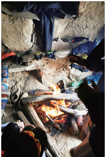
选手们在窑洞内烤火