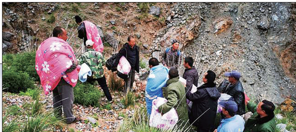
◀很多村民带上棉被上山救援