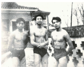
学生时代的袁隆平（左一）酷爱游泳

袁隆平专门带了一把小剪刀，然后两人“游了个痛快”。进入湖南杂交水稻研究中心工作后，袁隆平和团队成员每年12月到次年4月都要前往海南三亚的南繁基地进行科研攻关。早几年身体状况允许时，袁隆平几乎每天都要去海里畅游一番。