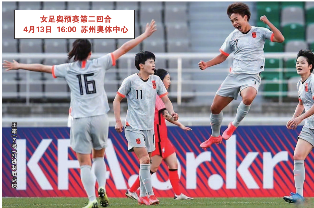
女足奥预赛第二回合 4月13日 16:00 苏州奥体中心