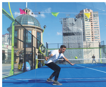
环球港都市运动中心

在逛商场的同时可以顺便攀个岩，家附近荒置多年的废旧厂房摇身一变成为运动中心……在上海，缺少体育场馆和运动场地将不再成为你远离体育锻炼的桎梏。近年来，上海市体育局通过发掘城市“金边银角”，拓展体商融合，鼓励民营力量参与体育场馆建设等方式，在寸土寸金的上海探索“体育+文化+教育+商业+旅游”等多元化运营方式，为市民提供体育健身和休闲娱乐等多元服务，提升上海市民参与体育活动的获得感和满意度。上海市体育局计划，到2025年，力争实现全市16个区都市运动中心全覆盖，试点在全市26个特色产业园区中建设都市运动中心，为市民提供多样化的体育场地设施服务。通过积极打造都市运动中心，助力上海建设全球著名体育城市，为市民体育健身提供更多新的可能。