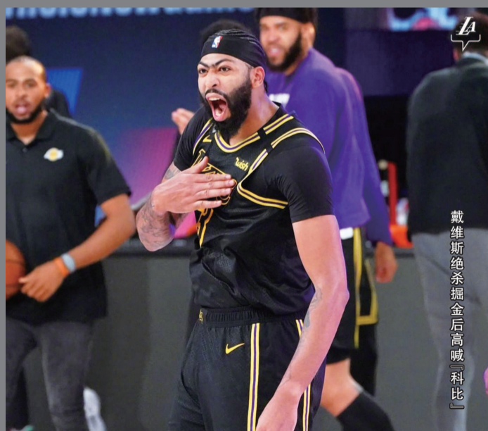
戴维斯绝杀掘金后高喊“科比”

对于湖人来说就打法看戴维斯和詹姆斯是球队最稳定的两个点，其他球员在进攻端是很难打开局面的，因此掘金会想方设法限制戴维斯，让米尔斯单防戴维斯，以此降低戴维斯的得分。如果詹姆斯陷入