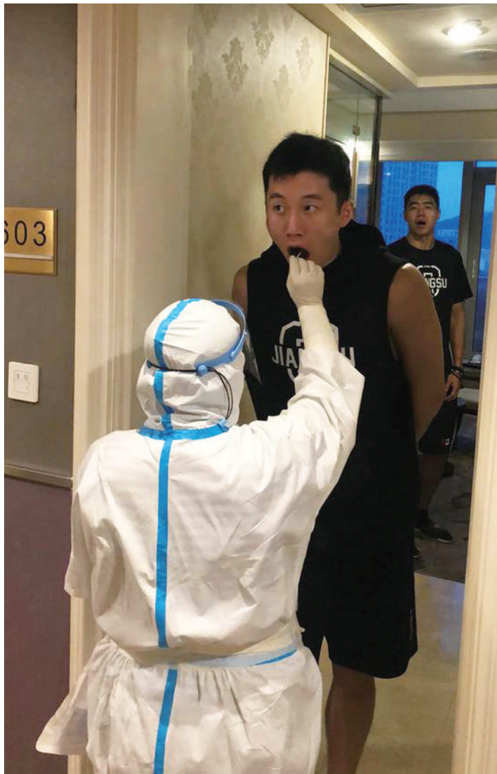
球员们在房间门口接受核酸检测

据了解，CBA公司昨日在青岛召集20家俱乐部总经理进行了一次闭门会议，最终确定青岛将继续承办第三阶段的比赛，即12进8、8进4和半决赛，而今年总决赛的举办地还需要根据实际情况另行确定。此前，中国篮协主席、CBA公司董事长姚明曾在接受采访时表示恢复球迷入场观赛是CBA公司努力的方向，而CBA联盟疫情防控首席专家钟南山也曾透露希望最后的总决赛能够开放一部分看台，供球迷入场观看。