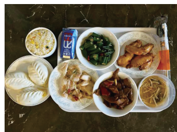
到达青岛后的第一餐