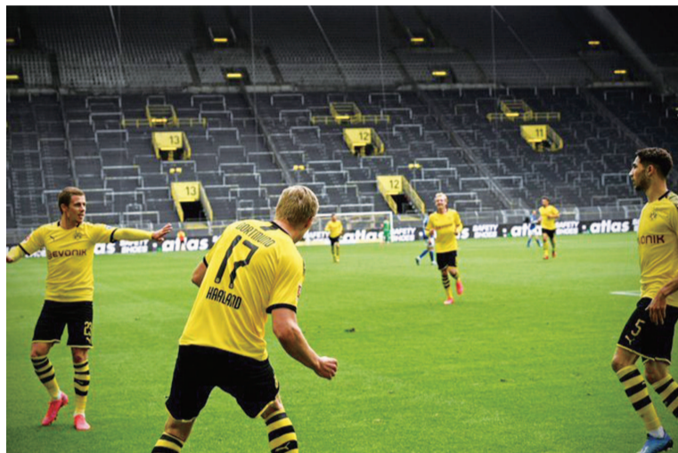
哈兰德攻进德甲重启的首粒进球后,阿什拉夫想冲向他一起庆祝,似乎第一时间被助攻的阿扎尔制止,提醒他不要靠近