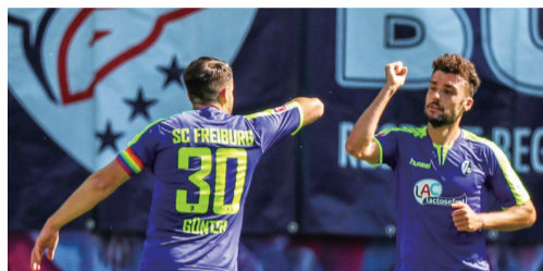
击肘庆祝和频繁消毒足球,在一段时间内都会成为常态