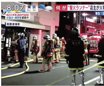
日本媒体报道火灾