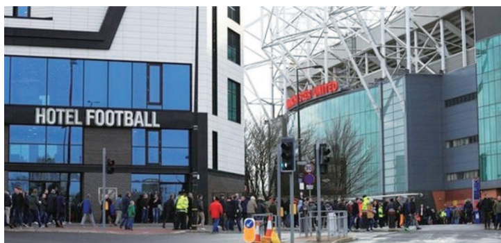
曼联名宿加里·内维尔宣布, 他和吉格斯合开的酒店Hotel Football和Stock Exchange Hotel将对公众关闭, 只用于免费提供给医护人员住宿或者隔离。此外他还保证, 在疫情期间, 酒店不会裁员, 也不会要求任何人降薪或无薪休假

这一计划初定为两个月, 之后再根据届时疫情判断是否延期, 具体开放的客房数量则取决于实际情况的需求, 如果必要, 整间酒店都会投入使用。值得一提的是根据英格兰媒体之前的报道, 由于疫情缘故, 阿布已经损失了惊人的24亿英镑, 不可谓不惨重, 但如果能借此机会修复与英国政府的关系, 却也是因祸得福了。