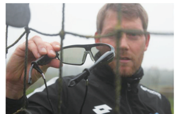
在训练方面,SAP也给予了强有力的技术支持。守门员使用Vision Pro眼镜来辅助训练,模拟球场视线受阻情况下进行扑救及发球,同时记录分析数据

除了MatchInsights之外,SAP还为霍芬海姆开发出了很多不为外人所知的黑科技,他们稳居德甲强队之列实非偶然。而在SAP的强大支撑下,霍芬海姆的强势崛起,岂是简单用钱来衡量的!