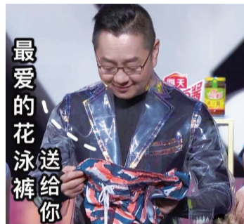
最爱的花泳裤送给你

更有意思的是庞博吐槽孙杨妈宝男的事情,“孙杨21岁想谈恋爱,结果孙杨的妈妈说太早了,21岁谈恋爱50岁岂不是结婚了;孙杨随后和妈妈叛逆,不过两人后来和好如初,因为妈妈觉得孙杨21岁叛逆太早了,要是21岁就不听妈妈的话,50岁岂不是都不听睡前故事了。”结果一席话把孙杨和孙杨爸爸笑得前仰后合。