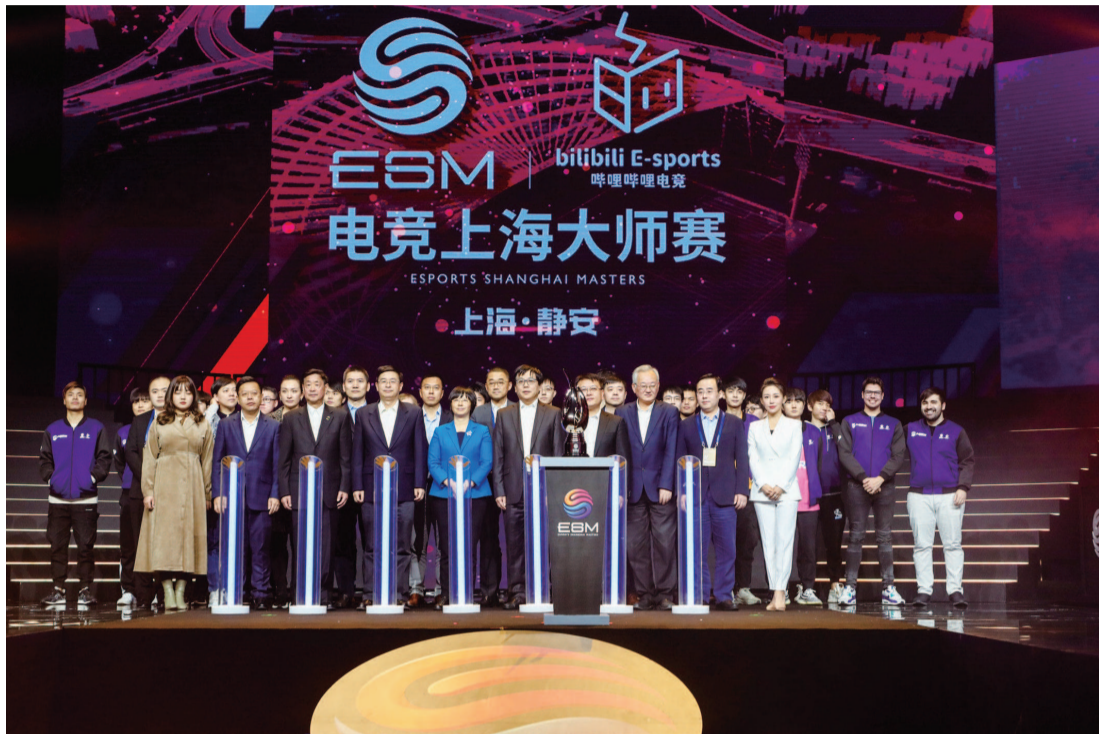
2019电竞上海大师赛助力申城打造全球电竞之都

每天比赛的最后,获得冠军的队伍和选手都会捧起大师赛奖杯。甚至有获得冠军的选手开玩笑地做出举动,想要把奖杯直接带走,因为他们觉得这座奖杯异常耀眼。但这座奖杯就和电竞大师赛一样,将永远属于上海。