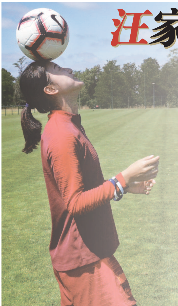
19岁的汪琳琳已是女足国青队长

12岁进入国少,18岁戴上国青队长袖标,19岁迎来成年队首秀,同年又入围了亚足联最佳女足年轻球员提名,汪琳琳的未来势必充满着无限光明。