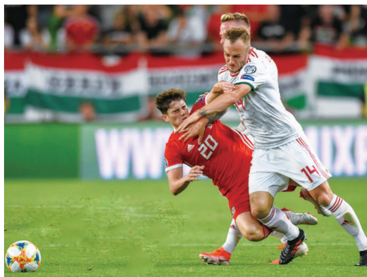
威尔士将与匈牙利殊死一搏

本场比赛初盘意大利让两球两球半101水,即时让两球/两球半91水,参照意大利客场让亚美尼亚一球半的盘口,本场只让两球/两球半明显让浅了,理论上应该让到两球半/三球才对。这也给玩家带来很多困惑,其实意大利上一场客场打波黑只让平半也明显偏浅,很多玩家认为是诱上投注下盘,结果上盘3比0顺利打出。本场比赛也会如此,意大利还是大胜赢球赢盘。