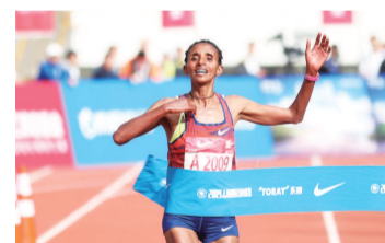
耶布古尔·梅莱斯·阿拉吉