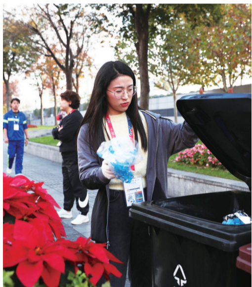
垃圾分类是本次上马非常重要的一个主题