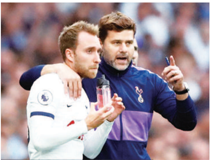
波切蒂诺决心弃用埃里克森

贝尔格莱德红星(以下简称红星)小组赛1胜1负,进3球失4球。红星在塞超联赛继续高歌猛进,在上周末的联赛中红星轮换了很多主力为本场冠军杯做准备。