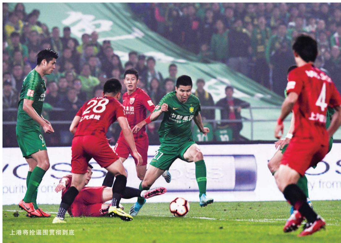
上港将抢逼围贯彻到底

事实上,面对国安之前,外界普遍对上港的状态感到担心,相比国安在间歇期内安排两场热身赛,上港在二十天左右的时间里,不曾进行一场比赛,而以往,球队间歇期归来后的首场比赛总是不在状态,“虽然没有踢比赛,但是整个间歇期里,我们训练当中一直在练逼抢,主要针对的就是这场比赛。”原本,球队也考虑通过热身赛来提升一下球员状态,然而,考虑到当时不少关键位置上的球员被抽调,因此最终还是打消了这一计划,改为彻底让球员养精蓄锐。技术统计显示,上港在总跑动距离上,比国安足足多了9公里,相当于多打一人,与赛季初超级杯上让出球权的打法所不同的是,上港此战主动施压,令国安整场比赛无法找到节奏。“比赛的进程和我们预计的一样,在打入一球后,局面更为开放,我们迫使国安去到两翼,继续通过逼抢限制对手。”佩雷拉说。