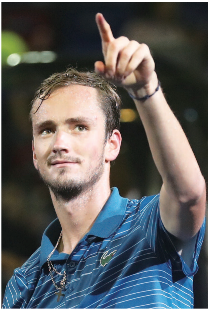
专题摄影 本报记者 陈嘉明

道歉、懊悔、交罚金，每回在赛场上闹了事，梅德维德夫的解决之法无外乎就是这几样。谁也不知道，他是不是真能做到下不为例。对此，他的同胞兼儿时偶像萨芬倒是在前两个月给出过建议。“他是坏小子？看看他，明明是个有魅力的人。他是个好脾气的人，看起来跟坏小子可差太远了。只是，他还缺少一点跟大众打交道的经验，这方面可得好好学习。”萨芬在当职业球员时，除了两夺大满贯男单的辉煌外，最出名的就属他的暴躁脾气了，球拍是他最常用的泄愤道具。有这样一位过来人传授经验的话，也许会对梅德维德夫的发展有所助益。