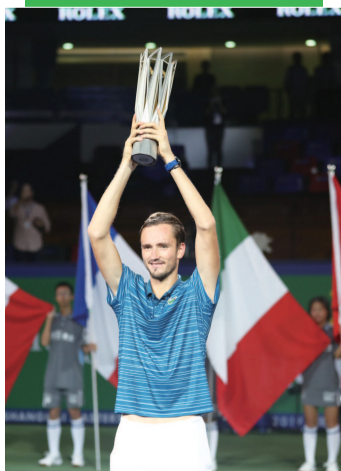
梅德维德夫在上海网球大师赛中夺冠