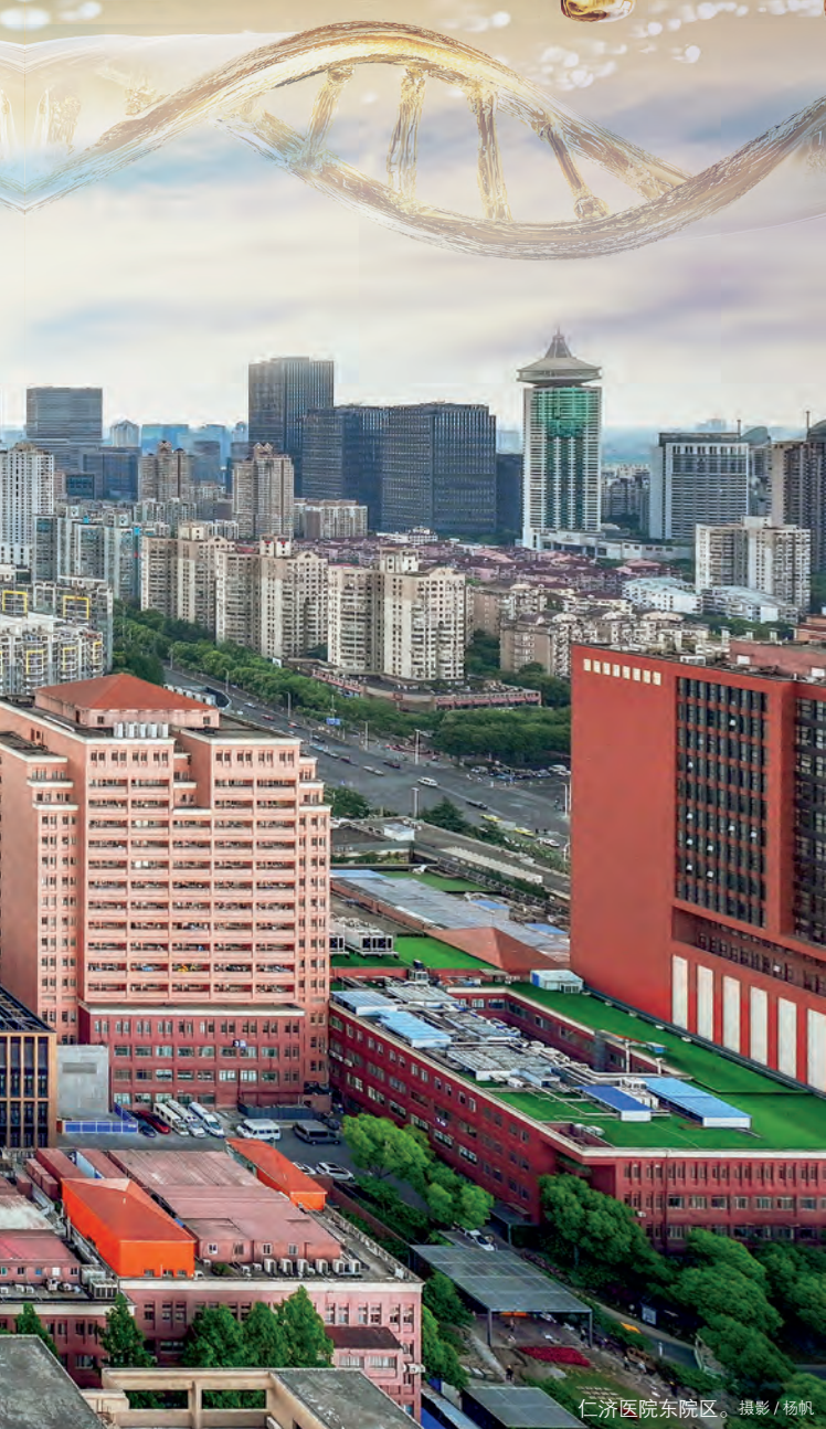
仁济医院东院区。

效、学科发展特色鲜明、科研活力实力兼具、管理服务专业优质，具有较强引领辐射能力和国际竞争力的国内一流创新型、研究型、智慧型、国际化医学中心，成为上海这座国际一流医学中心城市的标杆医院。