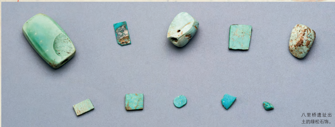
八里桥遗址出土的绿松石饰。