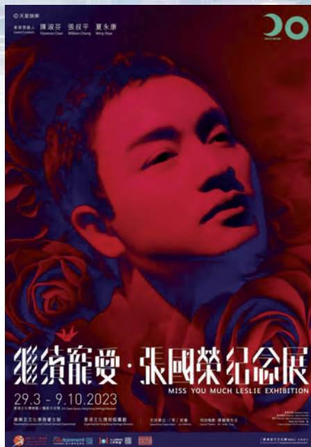
继续宠爱·张国荣纪念展。

这是TVB在张国荣逝世20周年纪念节目中的一段话，也说出了很多人内心的疑问——20年很长，长到足够忘记一个人，却为何，没有长到可以忘记张国荣？