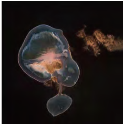
谭恩 MOSSAI 公布的《原·元》系列。