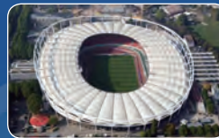
罗马尼亚：布加勒斯特