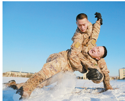
■ 战士们在严寒条件下进行格斗训练

这是能征善战的过硬营队,战争年代,历经大小战斗千余次,赢得“百战百胜”美名。这是敢于担当的先锋营队,演兵场上,敢打头阵、善于攻坚;维和战场,直面血火考验,圆满完成任务。这就是威名赫赫的陆军某旅三营。