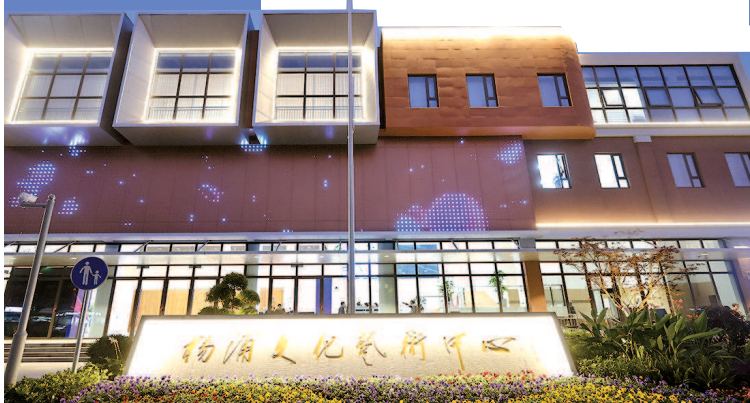
杨浦文化艺术中心外景