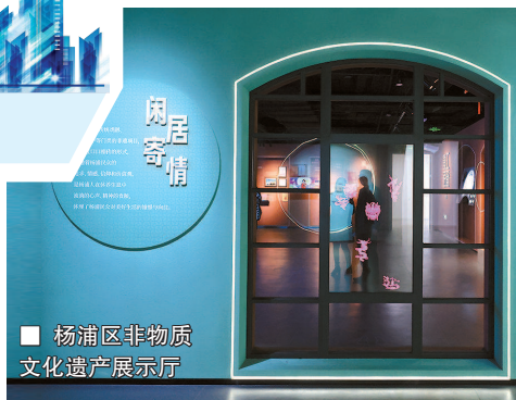
杨浦区非物质文化遗产展示厅

历经三年,作为“人民城市”理念首提地的杨浦区又多了一座市民“文化客厅”。今天下午,位于中原路188号的杨浦文化艺术中心(原杨浦区文化馆)以全新的面貌回到市民身边。