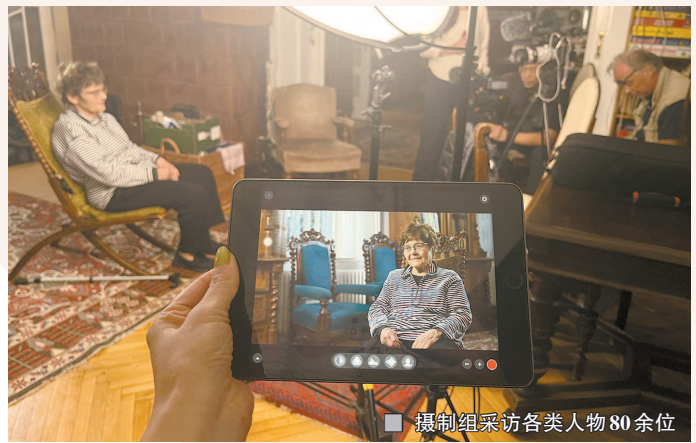
摄制组采访各类人物80余位