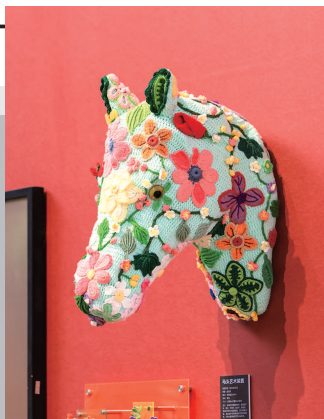
▲ 钩针编织技艺制作的马头艺术装置