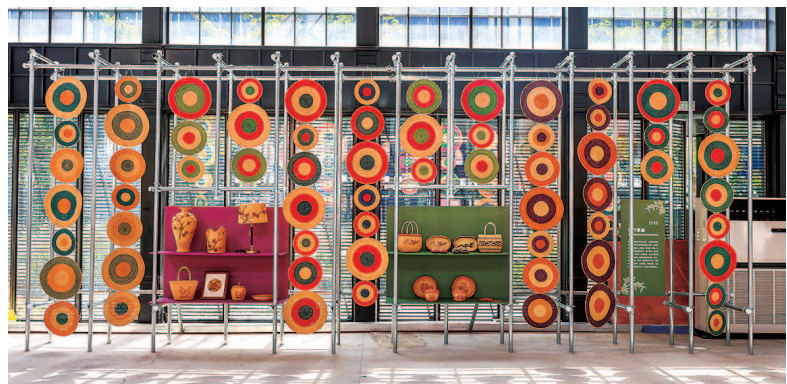
▲ 徐行草编技艺制作的多种生活用品

复古的火车站摇身变为艺术秀场，观众穿行于不同风格的场景中，移步易景，感受非遗美学的“人间烟火”。第35届上海旅游节重点活动之一的“造物十二时辰——上海非物质文化遗产生活美学展”集中展现了上海传统文化的独特魅力，以及近年来非遗走进现代生活的探索之路。展览通过中央复兴车站里十二时辰的时光流转，重点展示了十二项上海非遗代表性项