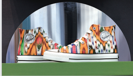
▲ 回力牌“艾德莱斯”非遗主题球鞋