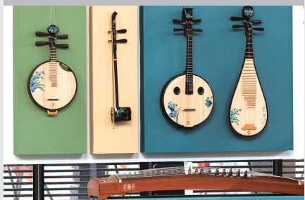
▲ 江南丝竹民族乐器