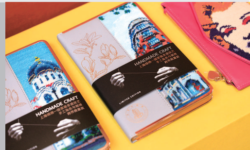
▲ 上海绒绣·笔记本和手包