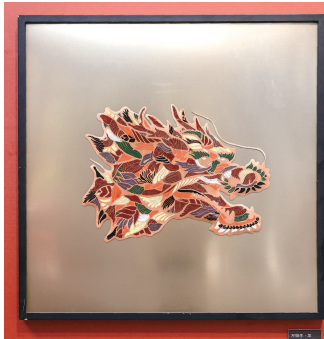
▲ 珐琅器制作技艺《万物生·龙》