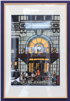
▲ 上海剪纸·南京东路