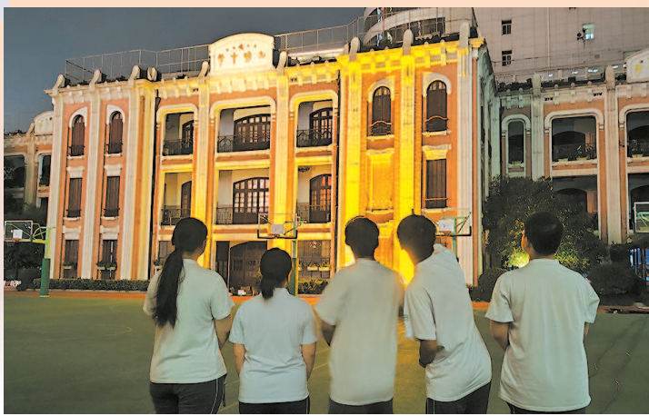
■ 今年8月,光明中学教学楼进行灯光测试,百年大楼流光溢彩