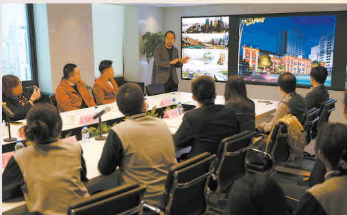
■ 同学们和专家座谈交流光影设计

9月19日,首届上海国际光影节开幕。点亮“光明”,就是孩子们送给光影节的一份礼物。