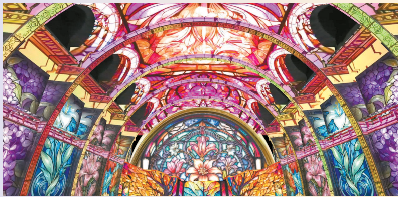
中央大厅沉浸式穹顶投影秀