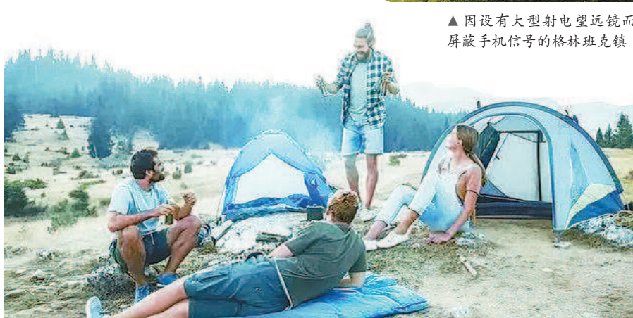
▲ 因设有大型射电望远镜而屏蔽手机信号的格林班克镇