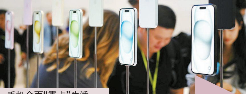
手机全面“霸占”生活

非智能手机在中国多被称为“老人机”,在英美等国也有“傻瓜手机”之称,甚至有一些老之未至、学历不低的人偏爱“傻瓜手机”,原因在于他们觉得“傻瓜手机”让自己变得更加平静,能将更多精力投入现实生活。