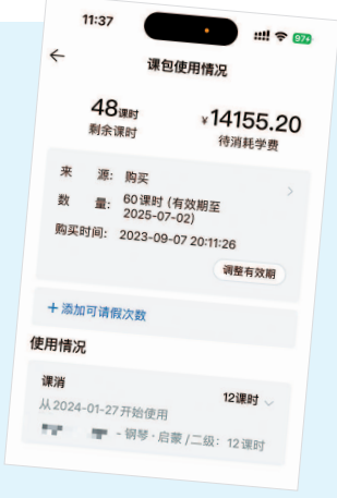
▲ 顾先生还剩48课时未上 ▲ 顾先生购买课程的协议

也赫然出现在转课方案中,剩余课时费竟能抵扣医美项目。 公开信息显示,上海音石教育科技有限公司成立于2021年,注册资本100万元,法定代表人为王某。目前,在上海的长泰和康桥两个校区均已停业。