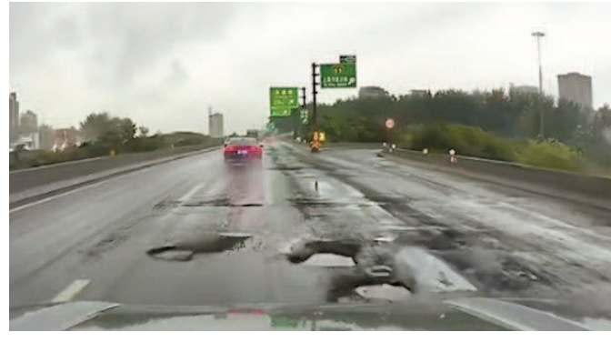
上海绕城高速之前一段路面坑塘严重影响行车安全

本报讯 (记者 陈浩)6月28日,本报第8版刊登报道《坑塘一个又一个 十多辆车接连爆胎》,反映S2沪芦高速近顺翔路跨线桥处路段因连日降雨,路面上出现不少坑塘,导致十多辆车爆胎。有市民反馈:在G1503上海绕城高速,有的路面也存在坑塘,对行车安全造成了较大隐患。