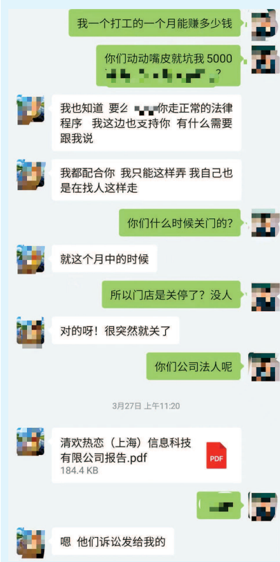
■ 红娘告诉沈先生公司已突然“关门”

消费者应该注意保护个人隐私,避免泄露过多的个人信息,比如身份证号、银行卡号等。如果发现个人信息被滥用或泄露,可以向12315、12345等热线投诉并寻求专业法律帮助。