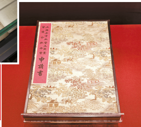
▲ 1956年1月,上海市工商业者向市人民委员会呈递《上海全市私营工商业申请公私合营申请书》

本报讯(记者 屠瑜)今天,“伟大飞跃——马克思主义中国化时代化文物史料专题展”在中共一大纪念馆开幕。本次展览共展出各类展品452件,其中文物文献267件,包括一级文物13件、二级文物21件、三级文物56件,其他等级文物及文献资料177件,力求全维度展现马克思主义中国化时代化的伟大理论成果与实践成就,首次在党的诞生地展出中山大