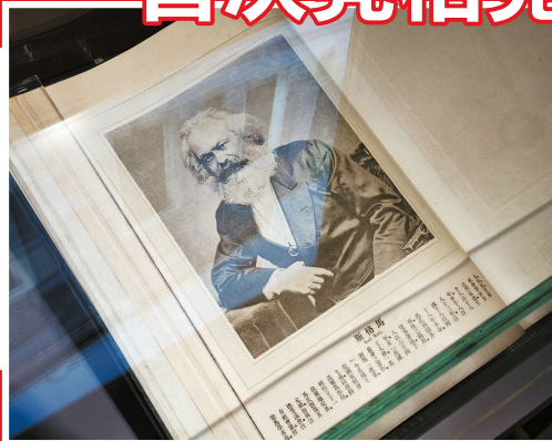
◀ 1907年在上海出版的《近世界六十名人》大画册,首次在中国刊出马克思的肖像