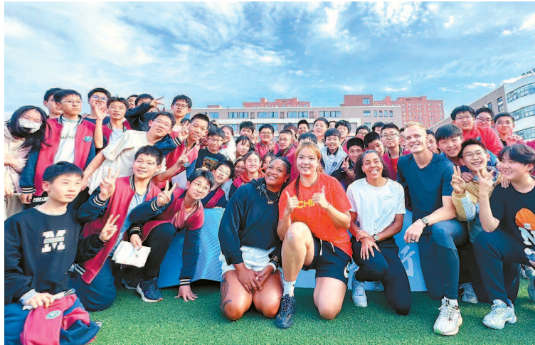
■ 参加长三角国际田径钻石赛的田径明星们走进苏州当地中学互动交流

4月27日,长三角国际田径钻石赛(上海/苏州)将在苏州奥体中心举行。本站世界田联钻石联赛在长三角区域一体化发展的时代背景下,作为体育产业践行国家战略的有益尝试,国际顶级体育赛事首度走出上海。在沪苏两地团队的精诚协作下,长三角国际田径钻石赛打开了一扇窗,树起了一座标杆。