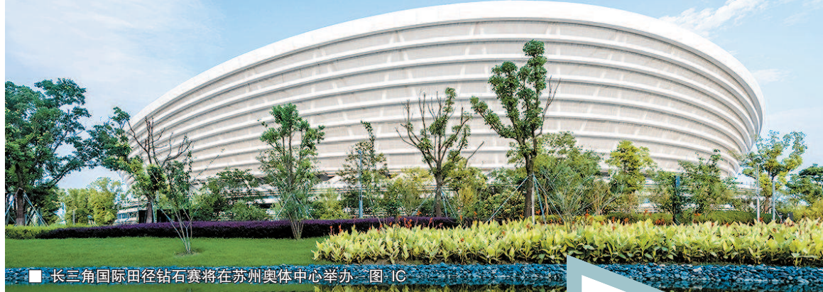
■ 长三角国际田径钻石赛将在苏州奥体中心举办