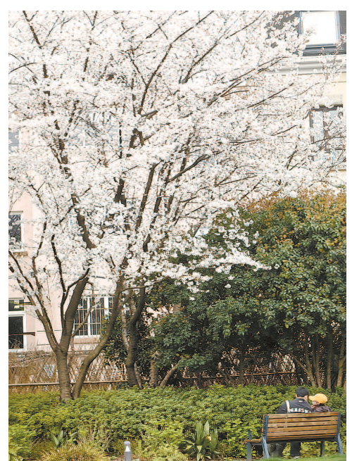
上海春日一瞥

我住的地方在赞美广场附近,平日遛弯的时候,我还顺便发现了一座书城“百胜楼”。这是一栋旧式的五层商业楼,建于上世纪80年代。其实在新加坡还有一个更“文艺”的书局,是如初路上的城市书房,我从东海岸公园喝完咖啡散步就去看两个小时书,买了一些以前从未读过的新加坡作家的小说。然而百胜楼是完全不同的风格,更像是二手书店的聚集地。在那里,我看到了自己写的一本书,繁体字版的《人间西游》有售,很高兴,像捕捉到了一种被祝福的缘分。