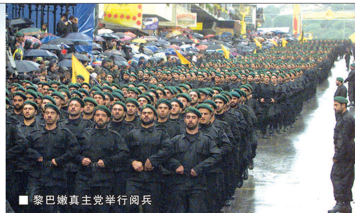
■ 黎巴嫩真主党举行阅兵

目前,真主党在黎国内拥有雄厚的力量,不仅在议会有13个席位,还在黎巴嫩南部拥有大量企业和物流港口,自身具有经济“造血”功能。真主党有一个全面的社会服务和卫生系统,由一个卫生部门、一个教育和社会部门组成。教育部门以相对较低的价格提供中小学教育。社会保障网络救济所有黎巴嫩人,无论其宗教或政治派别如何,并包括致力于建筑,退伍军人事务和