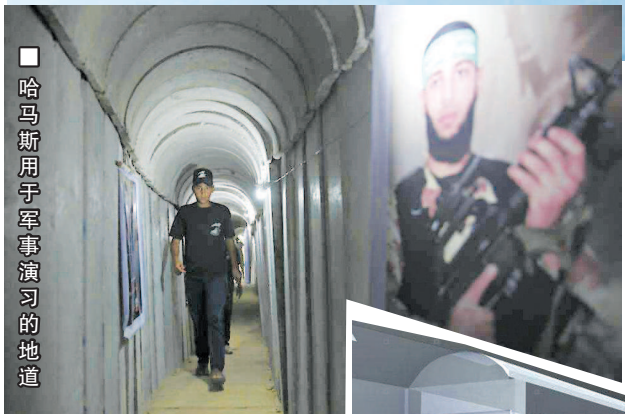
■ 哈马斯用于军事演习的地道