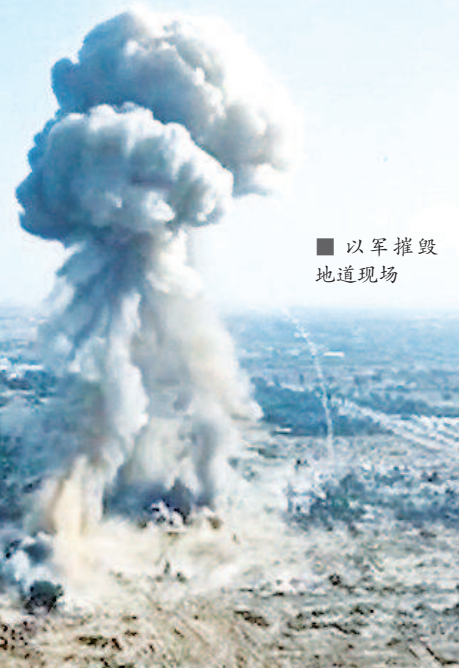
■ 以军摧毁地道现场