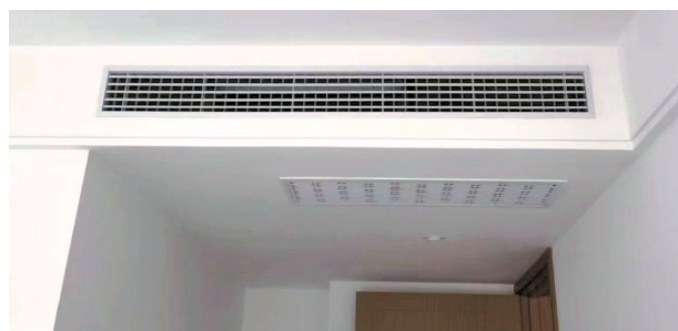
■ 开发商为业主重新更换了有出风导向的百叶风口

“这完全是两种型号，制热功效自然也不一样。”面对业主们的不满，开发商坦言，说明书上是他们一时疏忽写错了，HVR-50KFD/H2FZBp/P型号的内机适用于较大空间，是供客厅使用的，而北书房面积仅有6平方米左右，最初的规划本就是配备HVR-18KFD/H2FZBp/P型号，公司在施工前就向房管部门报备过。