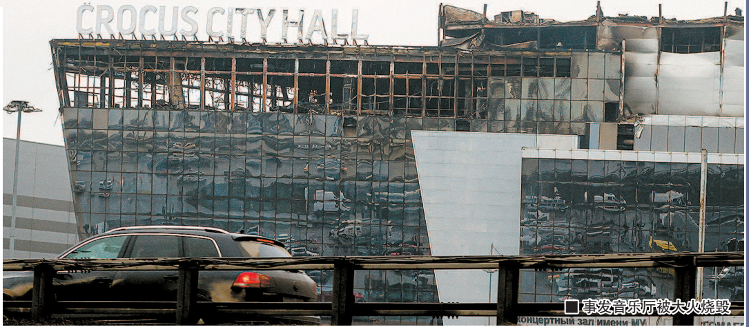
事发音乐厅被大火烧毁

俄罗斯总统普京23日发表电视讲话说，这是一场精心策划、血腥而野蛮的恐袭，是一场有准备、有组织、针对手无寸铁平民的大规模屠杀，并将24日定为全国哀悼日。