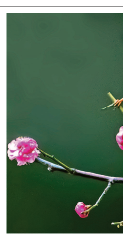
雀梅争春

大同向来是边防重镇、是捍卫北京的第一道屏障,历经多次险恶的战役。林徽因调研笔记中的大同古城注重防御、同时兼顾守城军民日常生活便利;其主体结构源自明代著名名将徐达构筑。据大同地方志记载:徐达所建的魏都城墙设东、南、西、北四座城门。其中东门就叫和阳门,取《道德经》“万物负阴而抱阳,冲气以为和”的美意,快马捷报即可直抵北京。南门叫永泰门,取泰卦“天地交,而万物通”的卦象;西门叫清远门,取古语“刑罚清而民服”中政治清明的寓意;北门叫武