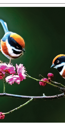
雀梅争春

是国家不可或缺的煤都和华夏面食之乡,但为了环保和可持续发展大局,煤炭行业的“关停并转”冲击波相当巨大。经多年努力消化了冲击波之后,光靠琳琅满目的面食博物馆是支撑不了经济发展体量的。于是在北京、天津等大都市高铁可以直达的前提下,文化魏都是希望!需要强调的是:古都大同,文脉悠长,禀赋独特,丰富的碑刻题记遗存,上承秦汉、下启隋唐,开创了波澜壮阔的魏碑书法艺术,成就了半部浓墨重彩的中国书法史。近年来,立足深厚历史文化底蕴,持续打造“魏碑故里、天下