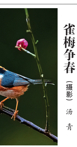
雀梅争春

完没了地著书立说。一次,我去医院探望病人时,曾见一位刚退休的先生,因为脑梗半身不遂。他妻子告诉我,先生工作严谨,退休了依然被热情邀请参与一部书的编撰。因为长期伏案工作,体力不支。才六十岁,就生活不能自理,沉痛的教训。