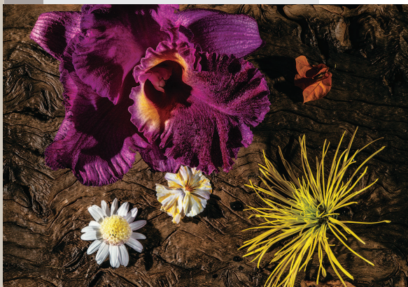
■ 卡特兰红葫芦与小花、朽木