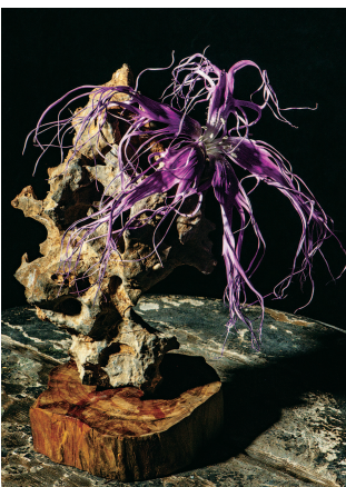
■ 伊势石竹与青州太湖石