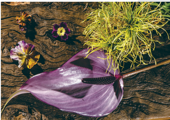
■ 彩掌与菊花、角董、老木