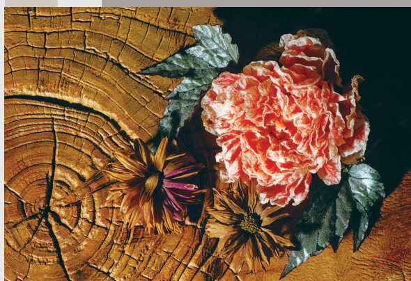
■ 石榴花、秋海棠叶、枯菊与老木