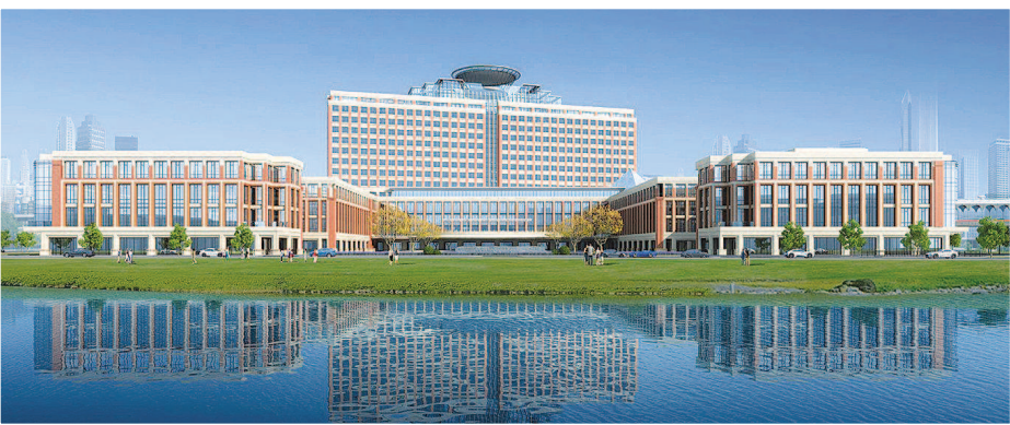
复旦大学附属中山医院青浦新城院区效果图