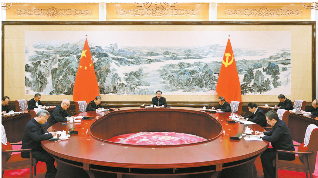
■ 12月21日至22日,中共中央政治局召开学习贯彻习近平新时代中国特色社会主义思想主题教育专题民主生活会,中共中央总书记习近平主持会议并发表重要讲话

■ 勇于自我革命是我们党最鲜明的品格和最大优势。中央政治局的同志要始终按照马克思主义政治家的标准严格要求自己,在洁身自好、廉洁自律上为全党树标杆、作表率